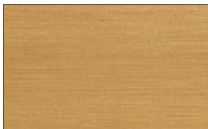
503-4264 eiche hell